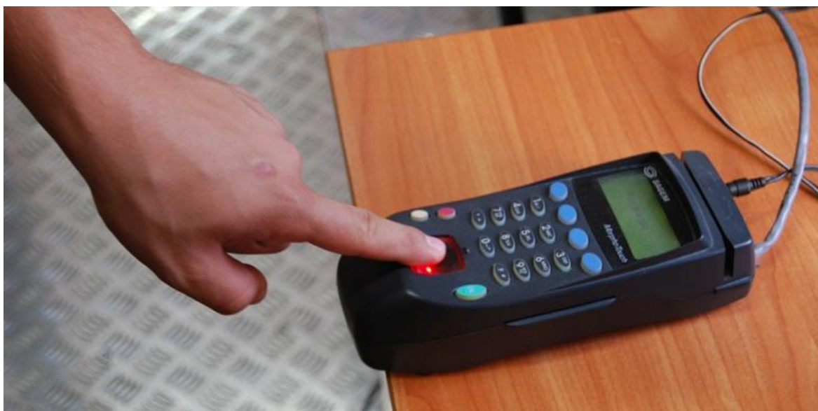
Skanowanie linii papilarnych opuszka palca wskazującego za pomocą urządzenia do szybkiej identyfikacji daktyloskopijnej MorphoTouch.

Dane zgromadzone w CRD mogą być w łatwy sposób wykorzystywane przez Policję i inne uprawnione podmioty do ustalenia, potwierdzenia lub weryfikacji tożsamości osoby za pomocą urządzenia do szybkiej identyfikacji daktyloskopijnej na podstawie odcisków linii papilarnych opuszek palców rąk 60 .