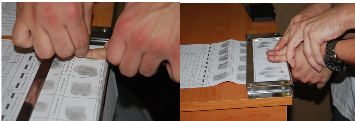
Daktyloskopowanie osoby metodą tradycyjną.

W celu przeprowadzenia wywiadu daktyloskopijnego należy dostarczyć do CRD lub przesłać za pomocą teleinformatycznego systemu transmisji obrazów kartę daktyloskopijną z odciskami linii papilarnych opuszków palców rąk NN osoby. Na karcie daktyloskopijnej w polu „powód daktyloskopowania” należy wpisać „WYWIAD”. W odpowiednie pola karty trzeba również wpisać posiadane dane o osobie, a w razie braku takich danych, wpisać wyraz „NN osoba”. Przekazane obrazy odcisków linii papilarnych porównywane są niezwłocznie z obrazami odcisków linii papilarnych zgromadzonymi w CRD. W przypadku stwierdzenia, że w CRD znajduje się karta daktyloskopijna odpowiadająca odciskom linii papilarnych przekazanym w ramach wywiadu daktyloskopijnego, zostaną przesłane informacje obejmujące okoliczności rejestracji oraz dane osoby wpisane do karty daktyloskopijnej 63 . Należy jednak pamiętać, że karta daktyloskopijna przekazana w celu przeprowadzenia wywiadu daktyloskopijnego, nie podlega rejestracji w CRD i po sprawdzeniu jej, zwracana jest jednostce zlecającej. Kopie plików zawierających dane daktyloskopijne powstałe w związku z daktyloskopowaniem na urządzeniach do elektronicznego daktyloskopowania, zapisywane są w elektronicznym archiwum CRD 64 .