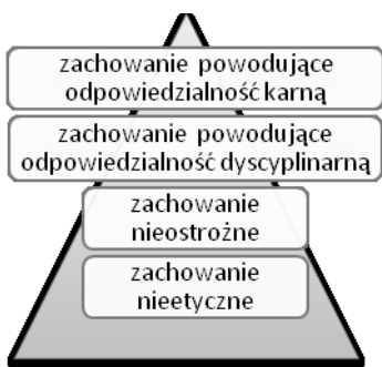
1) Koncepcja ustawodawcy.

Schematycznie przedstawić można różnicę, pomiędzy koncepcją leżącą u podstaw obecnej konstrukcji przewiania dyscyplinarnego w ujęciu ustawodawcy i sygnalizowanym w niniejszym artykule.