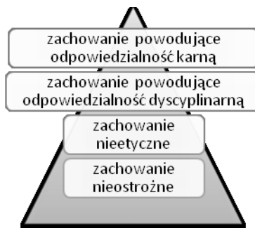
2) Koncepcja autorów artykułu.

Ustosunkowując się do reguł ostrożności jako przesłanki odpowiedzialności dyscyplinarnej funkcjonariusza Policji, poczynić należy jeszcze kilka uwag co do trzech drobnych kwestii.