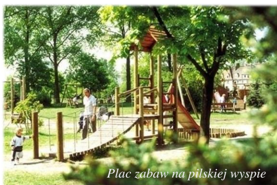
Plac zabaw na pilskiej wyspie

przepastnych lasów. Ich uroki docenił Jan Paweł II, który właśnie tutaj w 1978 roku wypooczywał i odbył spływ kajakowy. Trasa spływu od 1993 r. nazywana jest Jego imieniem. Na terenie Piły można zregenerować siły, korzystając z krytych basenów, kortów tenisowych, fitness klubów, a miłośnicy mocniejszych wrażeń mogą spróbować własnych sił ucząc się skakać na spadochronie bądź podziwiać pejzaż z lotu ptaka, wykorzystując do tego celu parolnię lub szybowiec. Miasto posiada zróżnicowaną bazę noclegową i gastronomiczną oraz dobrze wyposażone sale konferencyjne dla turystyki biznesowej. Piła - największe miasto regionu, to także centrum życia kulturalnego. Organizowane imprezy kulturalne i sportowe