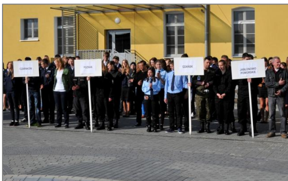
Prezentacja drużyn biorących udział w Turnieju.

O tym, czy któraś z wymienionych szkół sięgnie po raz drugi po upragniony tytuł, dowiemy się już jutro. Dotychczasowi laureaci nie mogą jednak czuć się pewnie, ponieważ każda z dotychczasowych edycji Turnieju miała swoją dramaturgię i nieraz już pewni, przed ostatnią konkurencją, zwycięzcy, tracili pierwszą pozycję na rzecz niżej sklasyfikowanych zespołów. Jak mawiał bowiem jeden z najbardziej utytułowanych polskich trenerów, Kazimierz Górski – „dopóki piłka w grze, wszystko jest możliwe”. Tym razem jednak cytowaną piłkę zastąpią umiejętności i wiedza uczestników.