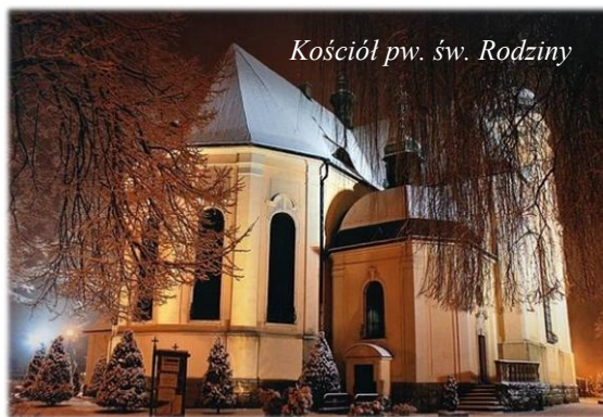
Kościół pw. św. Rodziny

muzycznych i artystycznych, zarówno profesjonalnych jak i amatorskich, jest Regionalne Centrum Kultury „Fabryka Emocji” i funkcjonujący w niej Teatr Miejski, organizator Ogólnopolskiego Festiwalu Teatrów Rodziny