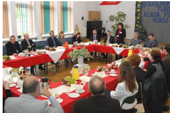
Uczestnicy spotkania dyrektorów.

„Elementarza Bezpieczeństwa” adresowany dla przedszkoli i szkół podstawowych, a tworzony przez uczniów klas „policyjnych”.