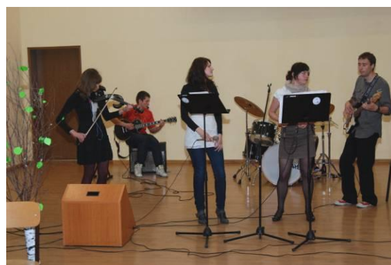
Zespół Future Artists podczas koncertu.

Jury przyznało także wyróżnienia: za scenariusz dla Zawsze bądź rozważny ( Zespół Szkół Ponadgimnazjalnych nr 2 im. KEN w Pile ), za zdjęcia i montaż do przedstawienia Dropsy autorstwa uczniów XVI Liceum Ogólnokształcącego im. Armii Krajowej w Tarnowie . Trzecie wyróżnienie zdobył spektakl Ludzkie dno autorstwa uczniów z XIV Liceum Ogólnokształcącego w Zespole Szkół Elektrycznych i Ogólnokształcących im. mjr Henryka Sucharskiego w Katowicach . Czwartym wyróżnieniem nagrodzono przedstawienie Spotkanie przyjaciół w wykonaniu uczniów VII Liceum Ogólnokształcącego w Zespole Szkół Ogólnokształcących nr 3 w Legnicy .