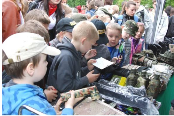
Dzieci chętnie korzystały z okazji, by z bliska obejrzeć sprzęt, który na co dzień wykorzystywany jest przez funkcjonariuszy Policji.

Pokazom towarzyszyły liczne ekspozycje. Funkcjonariusze Komendy Powiatowej Państwowej Straży Pożarnej w Pile zaprezentowali specjalistyczny sprzęt i wyposażenie pożarnicze Specjalistycznej Grupy Ratownictwa Chemiczno-Ekologicznego – w postaci samochodu gaśniczego GBA-2/24, separatora oleju ZRE-3, samochodu