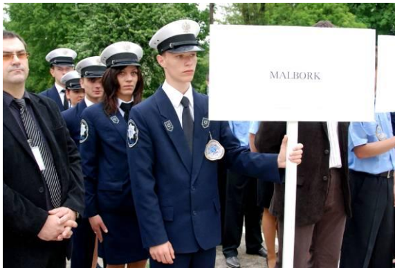
Reprezentacja Zespołu Szkół Ponadgimnazjalnych nr 4 w Malborku.

kilkunasto- a nawet kilkutyśięcznych miejscowościach.