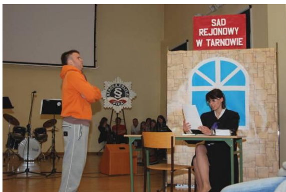
Prezentacja nagrodzonych spektakli.

Rozbite szyby, Wróg w mojej klasie, Czerwony Kapturek dziś - to tytuły spektakli profilaktyczno-edukacyjnych, które zajęły pierwsze trzy miejsca w II Ogólnopolskim Turnieju Szkół Ponadgimnazjalnych z Klasami o Profilu Policyjnym.