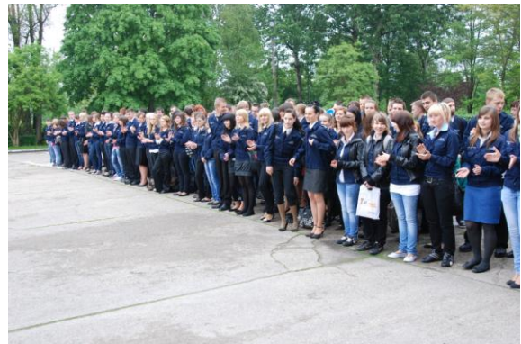
Uczniowie klas o profilu policyjnym z ZSP nr 2 w Pile na uroczystości otwarcia Turnieju.

tych, których społeczeństwo darzy wysokim poziomem zaufania.