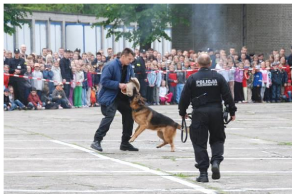
Pokaz umiejętności psów służbowych.

Sprzęt policyjny - samochód z wideorejestratorem, samochód do oględzin miejsca wypadku komunikacyjnego oraz wyposażenie do działań specjalistycznych Grupy Realizacyjnej prezentowali funkcjonariusze Komendy Powiatowej Policji w Pile