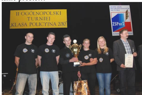
Zwycięska drużyna Zespołu Szkół we Wroniu.