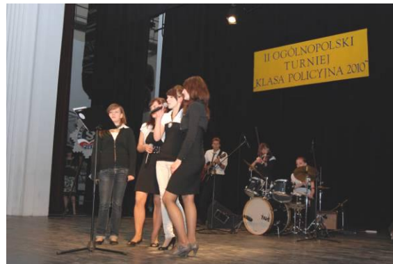
Część artystyczna - występ zespołu Future Artists - składającego się z uczniów ZSP nr 2 w Pile.

kadra obydwu szkół - organizatorów, słuchacze, uczniowie klas policyjnych. Cały Turniej uświetniały występy artystyczne uczniów z Zespołu Szkół Ponadgimnazjalnych nr 2 im. KEN w Pile.