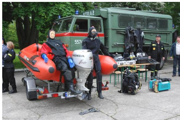
Prezentacja sprzętu ratownictwa chemiczno-ekologicznego i wodnego.

Broń długą i krótką, umundurowanie oddziałów prewencji, RGZ, wyrzutnie do granatów RWGL3, pistolety sygnałowe, miny dymne i gazowe prezentowali nauczyciele Zakładu Interwencji Policyjnych Szkoły Policji w Pile.