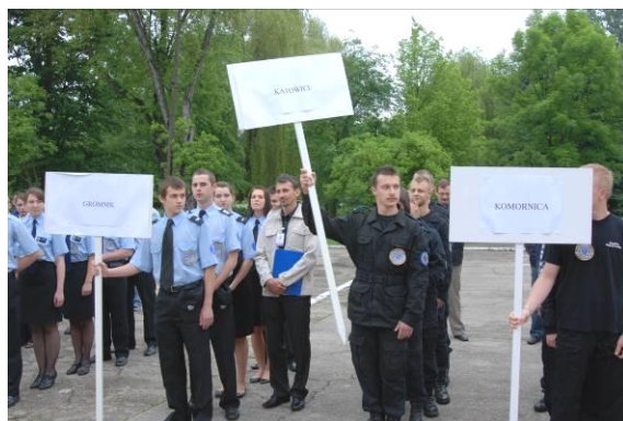
Prezentacja reprezentacji szkół biorących udział w Turnieju.

Ponadto do programu wprowadzona została nowa konkurencja - test umiejętności w zakresie udzielania pierwszej pomocy przedmedycznej.