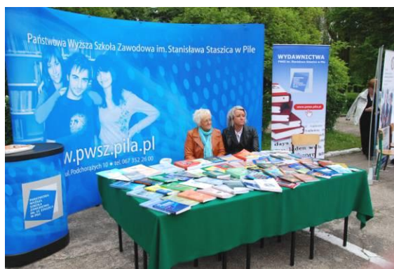
Stoiska promocyjne Wyższej Szkoły Biznesu w Pile i Państwowej Wyższej Szkoły Zawodowej w Pile.

O godzinie 9.00 na placu alarmowym cykl pokazów zainaugurowali funkcjonariusze z Komendy Powiatowej Państwowej Straży Pożarnej w Pile. Goście w niezwykle atrakcyjny i sugestywny sposób zaprezentowali działania na miejscu wypadku komunikacyjnego - przyjazd wozu bojowego ze specjalistycznym wyposażeniem na miejsce zdarzenia, rozpoznanie, przepro-