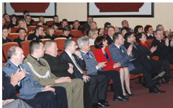
Uroczystość zakończenia Turnieju.

Turniej jest autorskim pomysłem pilskiej Szkoły Policji, który ma służyć upowszechnianiu wiedzy na temat bezpieczeństwa i porządku publicznego oraz integracji młodzieży klas policyjnych. Jest on także okazją do spotkania dyrektorów szkół, w których prowadzone są klasy o profilu policyjnym, w celu wymiany dobrych praktyk.